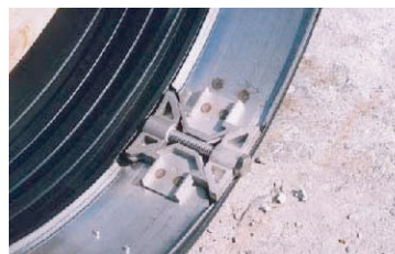
ステンレスウェッジ